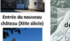
Château-fort de Miolans