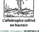
L'allobrogica cultivé en hautain